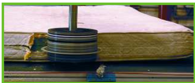
Démantèlement des matelas