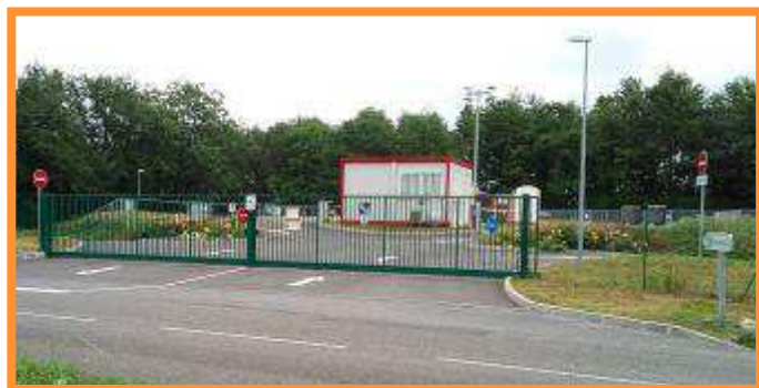
Déchèterie de Barry d'Islemade, route de La Ville Dieu du Temple

Depuis le 1 er janvier 2017, le SIEEOM gère la déchèterie de Barry d'Islemade située sur la route de Montech ( voir page 1 ). Au vue de sa proximité avec la déchèterie/recyclerie de Lafrançaise ( 10 mn en voiture ), nous avons modifié et étendu ses horaires d'ouverture afin qu'ils soient complémentaires avec ceux de Lafrançaise. Ainsi les habitants de ce secteur ont désormais au moins une déchèterie ouverte du lundi au samedi de 9 h à 12 h et de 13 h 30 à 17 h ( voir horaires des déchèteries en dernière page ).