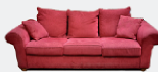
SIEGES / REMBOURRES