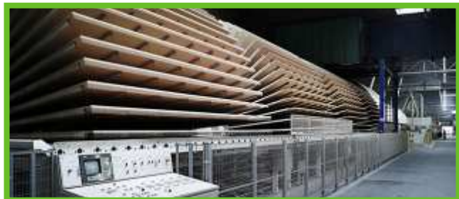
Ci-dessus : Usine de fabrication de panneaux à particules issues du recyclage de meubles en bois

Dans ce cadre, la déchèterie de Lauzerte ouvrira une benne « Mobilier » le 1 er juillet 2017. Vous pourrez y déposer vos meubles hors d'usage de type : étagère, placard, commode, table, chaise, fauteuil, canapé, lit (matelas et sommier)... Votre agent d'accueil sera là pour vous guider.